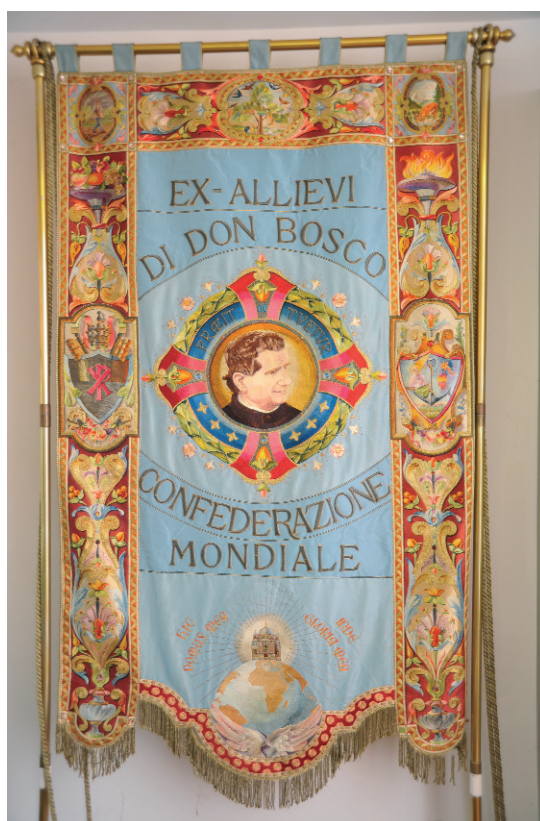
Edición realizada en el centenario de la Asociación de Exalumnos y Exalumnas de don Bosco